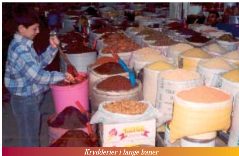
Krydderier i lange baner